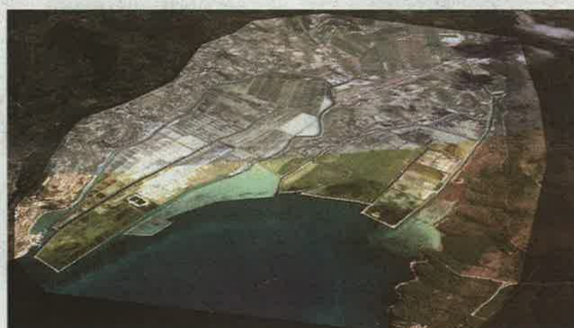
Verodostojna maketa Sečoveljskih solin, ki je največja tovrstna maketa na svetu in je prirejena tudi za slepe obiskovalce.