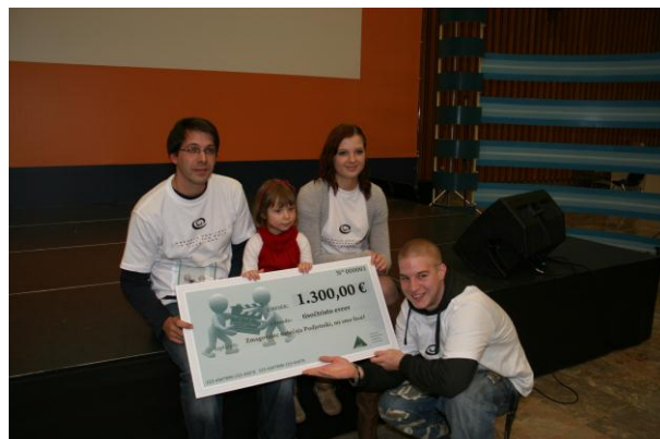
Slika 2: Zmagovalci natečaja Podjetniki, mi smo face!; oglas Ohranjanje okolja je otročje lahko.

Izmed množice video spotov so se odločili za najbolj inovativne izmed njih, in sicer za oglase Ohranjanje okolja je otročje lahko , Glasbena oaza neandertalcev , in Sayphone , ki si jih lahko pogledate na spletni strani Televizije Slovenije .