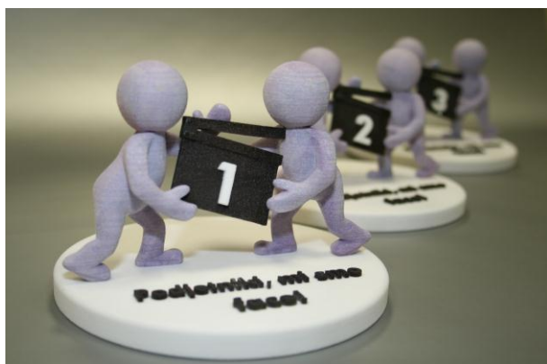
Slika 1: 3D natisnjeni pokali za zmagovalce natečaja Podjetniki, mi smo face!

V začetku decembra je v organizaciji JAPTI-ja, Javne agencije RS za podjetništvo in tuje investicije, na Gospodarskem razstavišču v Ljubljani potekal 5. Slovenski forum inovacij. V okviru Foruma je potekal tudi natečaj Podjetniki, mi smo face! , za katerega smo v podjetju IB-PROCADD d.o.o. izdelali pokale za prva tri mesta.