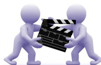
Slika 5: Referenčna predloga za začetek modeliranja.

Avtorji omenjenih oglasov so poleg ostalih nagrad prejeli tudi pokale, zmodelirane in 3D natisnjene v podjetju IB-PROCADD . Pokali so nastali na podlagi referenčne predloge, na osnovi katere smo v 3D programski opremi pripravili modele za tiskanje. Modele smo natisnili na 3D tiskalnikih podjetja Z Corporation in nastali so pokali za zmagovalce.