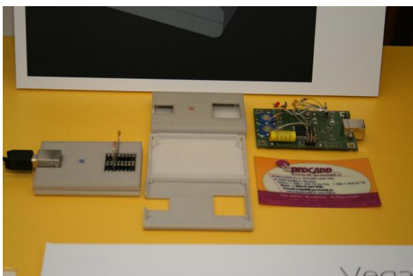
Sliki 6 in 7: Vega multi, Boštjan Šuhel s.p.

V podjetju IB-PROCADD d.o.o. smo s 3D tiskalnikom natisnili tudi 3D modele, ki ste jih videli na razstavnem prostoru podjetja XLAB d.o.o. Njihova inovacija PHOV (Photo Field Of View) je računalniška storitev, ki uporabniku omogoča rekonstrukcijo trirazsežnega modela iz množice digitalnih fotografij. Več o tem enostavnem in cenovno ugodnem postopku zajema slik si preberite tukaj .