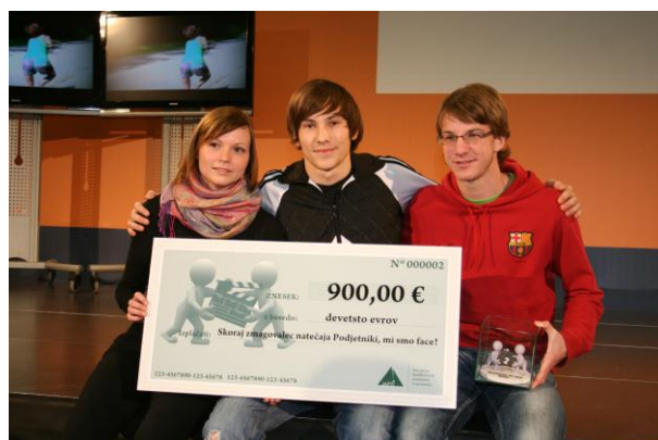
Slika 4: Skoraj zmagovalci natečaja Podjetniki, mi smo face!; oglas Sayphone.

Avtorji omenjenih oglasov so poleg ostalih nagrad prejeli tudi pokale, zmodelirane in 3D natisnjene v podjetju IB-PROCADD . Pokali so nastali na podlagi referenčne predloge, na osnovi katere smo v 3D programski opremi pripravili modele za tiskanje. Modele smo natisnili na 3D tiskalnikih podjetja Z Corporation in nastali so pokali za zmagovalce.