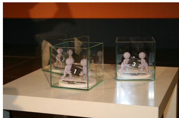
Slika 10: Pokali za najboljše na natečaju Podjetniki, mi smo face!

Če se Slovenskega foruma inovacij niste uspeli udeležiti, vas vabimo, da si ogledate virtualni katalog inovacij . Več fotografij pa si oglejte na spletnem portalu www.3Dt.si .