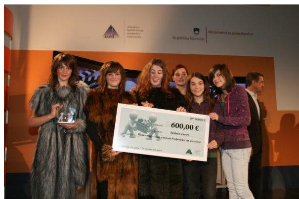
Slika 3: Blizu zmagovalcu natečaja Podjetniki, mi smo face!; oglas Glasbena oaza neandertalcev.