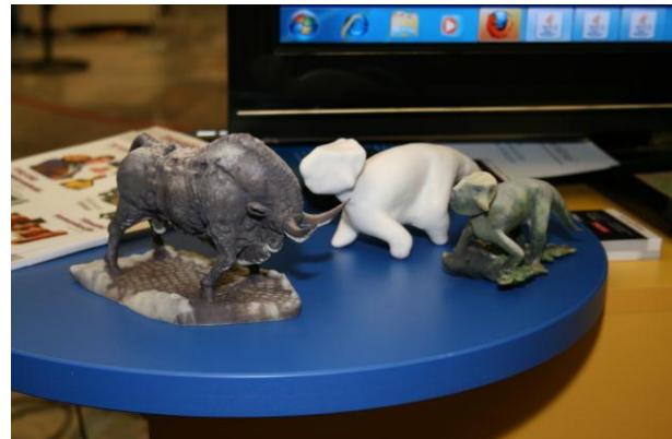
Sliki 8 in 9: PHOV (Photo Field Of View); XLAB d.o.o.

Če se Slovenskega foruma inovacij niste uspeli udeležiti, vas vabimo, da si ogledate virtualni katalog inovacij . Več fotografij pa si oglejte na spletnem portalu www.3Dt.si .